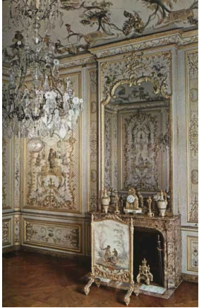
Замок Шантильи, камин из алепской брекчии, XVIII век.

Существует несколько разновидностей брекчии разных цветов и с разными рисунками: брекчия Меду, алепская брекчия, брекчия Сен-Максимин и жёлтая брекчия Бену. Брекчии применяются как при изготовлении мебели, так и для украшения каминов. Их использовали в самых прекрасных работах, в частности, алепскую брекчию, которая часто использовалась для каминов в XVIII веке. Один такой прекрасный камин находится в замке Шантильи.