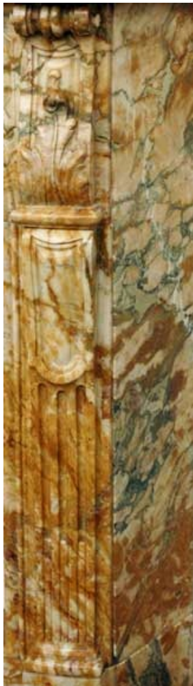
Элемент из брекчи Бену