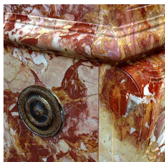
Элемент из брекчи Сен-Максимин