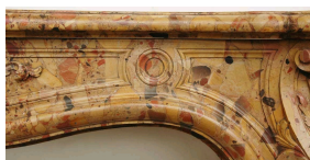
Элемент из алепской брекчи