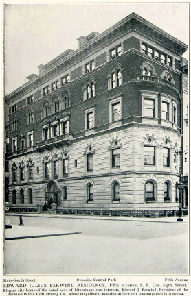
Фасад дома Эдварда Дж. Бервинда на Пятой авеню, Нью-Йорк, США.

Предприятие имело успех. Бервинд стал одним из крупнейших производителей угля в США на рубеже 19-20 веков и основателем нескольких городков в Западной Виргинии и Пенсильвании. Со временем компания принялась экспортировать уголь в Южную Америку, Западную Индию и Европу. Быстро заработав свой первый миллион, Эдвард Дж. Бервинд в 90 годы 19 века перенёс головной офис своей фирмы в Нью-Йорк. Тут он приобрёл огромный дом на Пятой авеню и увлёкся коллекционированием предметов искусства, продемонстрировав утончённый вкус к картинам и коврам, которыми украсил свой особняк.