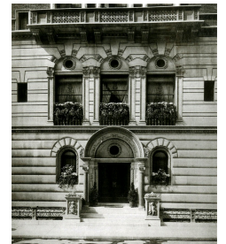
Фасад дома Эдварда Дж. Бервинда на Пятой авеню, Нью-Йорк, США.