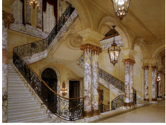
Спроектированная Жюлем Алларом парадная лестница в Элмс, имении Эдварда Дж. Бервинда в Ньюпорт-бич.