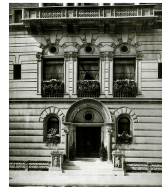
ENTRANCE DETAIL