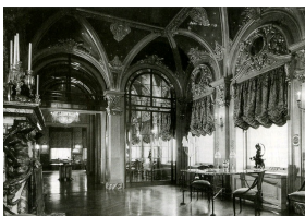
Холл второго этажа дома Эдварда Дж. Бервинда в Нью-Йорке. В левой части снимка виден большой монументальный камин, спроектированный Жюлем Алларом.