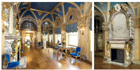
Холл второго этажа дома Эдварда Дж. Бервинда в Нью-Йорке. В левой части снимка виден большой монументальный камин, спроектированный Жюлем Алларом.