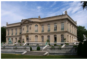
Элмс, Ньюпорт-бич, США. Имение Эдварда Дж. Бервинда в Ньюпорт-бич.