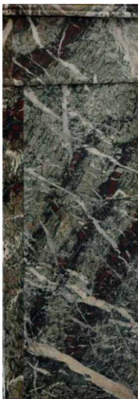
Элемент из кампанского мрамора смешанного цвета.