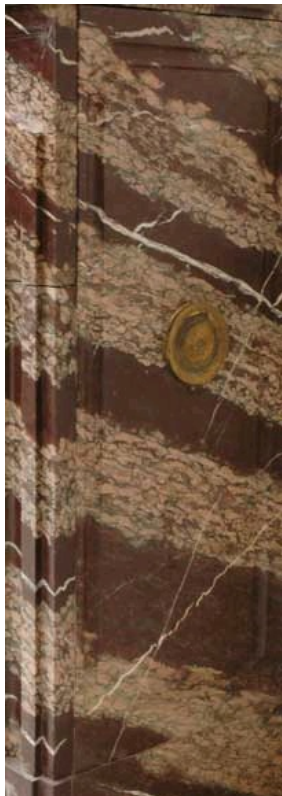
Элемент из кампанского мрамора с переплетениями.