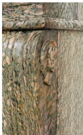
Элемент из зелёно-розового кампанского мрамора.