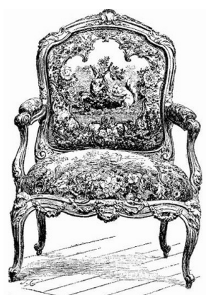
LOUIS XV. CARVED AND OILY "FAUTEUIL." Upholstered with Beauvais tapestry. Subject from La Fontaine's Fables.