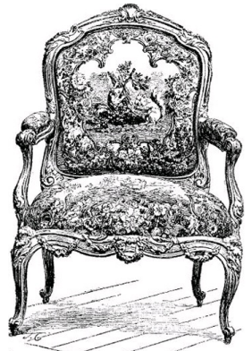
LOUIS XV, CARVED AND GILT "FAUTEUIL," Upholstered with Bouwens tapestry. Subject from Le Fontaine's Fables.