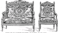
CHAISE AND SOFA DE BARRIS DE BETHA AND FATHAL DE AYO D'AYE (Cabinet des Médailles de la Bibliothèque Nationale) (Paris, Paris de Louis XVI)