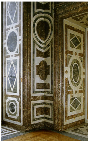
Элемент мраморной облицовки салона Дианы, Версальский замок.