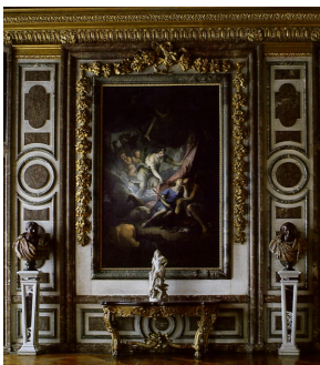
Салон Дианы, стены которого украшены крупным архитектурным профилем из красного Ранского и зелёного кампанского мрамора, Версальский замок.

Людовик XIV добавил к фасаду замка Версаль, построенному при Людовике XIII, колоннаду из Ранского мрамора. Красный Ранский мрамор, или "Старый Ранс", как представляется, наиболее широко использовался при украшении замка, в частности, в Зеркальной галерее, Большом вестибюле, в различных салонах, а также применялся для изготовления портиков, облицовочных панелей, карнизов... Красота красного Ранского мрамора вполне отвечала желанию Людовика XIV применять в Версале самые благородные отделочные материалы. В течение 1660-1670 годов с подачи Кольбера во французской архитектуре велась настоящая "мраморная" политика. Ресурсы Севера, который в те времена относился к Франции, были, в первую очередь, знамениты благодаря красному Ранскому мрамору. Во времена строительства замка основную часть мрамора поставлял расположенный в Рансе карьер Маржель, однако он уже не мог удовлетворить всех потребностей, тем более что строителям требовались всё более и более крупные блоки для изготовления колонн. Поэтому для выполнения растущих объёмов заказов было принято решение открыть новую разработку "Крупноблочная шахта", которую в дальнейшем называли просто "Версальской шахтой".