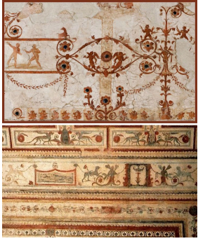
стена с рисунком в "Золотом доме" Нерона, Рим.