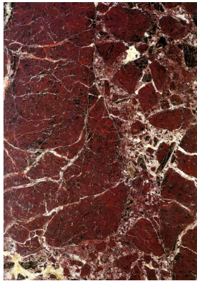
Образец мрамора Красный Левенто

Красный Левенто (Rosso Levanto) представляет собой серпентинитовую породу: сходство этой породы с брекчией и его тёмная расцветка придают ему большую выразительность. Начало добычи Красного Левенто восходит к XII веку, когда карьеры находились на лигурийском побережье Италии. С тех пор в этом регионе были открыты девятнадцать карьеров, поставлявших этот мрамор. На сегодняшний день ведётся разработка только двух карьеров: Сан-Джорджио и Россола в коммуне Бонассола, в Лигурийских Аппенинах, к юго-востоку от Генуи. Красный Левенто известен и используется во всём мире.