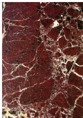
Образец мрамора Красный Левенто

Красный Левенто (Rosso Levanto) представляет собой серпентинитовую породу: сходство этой породы с брекчией и его тёмная расцветка придают ему большую выразительность. Начало добычи Красного Левенто восходит к XII веку, когда карьеры находились на лигурийском побережье Италии. С тех пор в этом регионе были открыты девятнадцать карьеров, поставлявших этот мрамор. На сегодняшний день ведётся разработка только двух карьеров: Сан-Джорджо и Россола в коммуне Бонассола, в Лигурийских Аппенинах, к юго-востоку от Генуи.