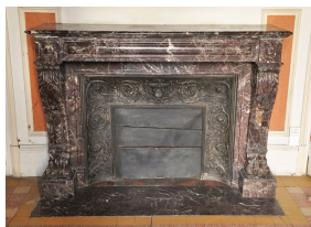
Старинный камин в стиле Наполеона III, выполненный из Красного Левенто в XIX веке

Столешница столика, входящего в великолепный набор мебели, который был выполнен Микеланджело Гуггенгеймом для Палаццо Пападополи в Венеции, также изготовлена Красного Левенто.