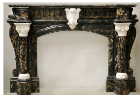
образец мрамора Портор.

Самым красивым считается мрамор глубокого чёрного цвета с ярко-жёлтыми прожилками, похожими на золотые нити. Видимо, эта разновидность мрамора получила своё название от имени города Порто-Венере, расположенного на побережье рядом с Генуей, где Людовик XIV повелел организовать разработку мраморных карьеров для украшения Версаля. Этот мрамор широко использовался в XVII, XVIII и XX веках в эпоху Арт-Деко, и сейчас его можно увидеть на многих восхитительных предметах мебели, предметах искусства и каминах.